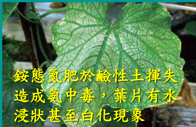
銨態氮肥於鹼性土揮失造成氮中毒，葉片有水浸狀甚至白化現象