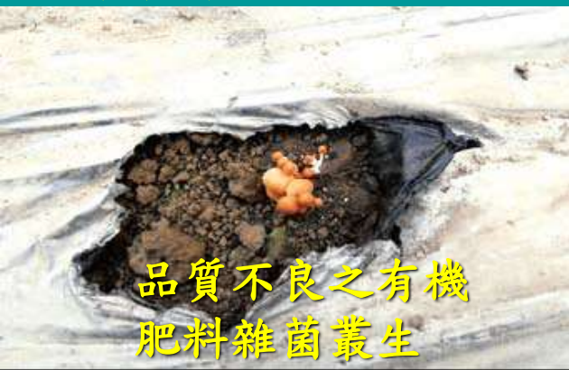
品質不良之有機肥料雜菌叢生