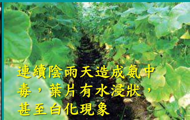
連續陰雨天造成氮中毒，葉片有水浸狀，甚至白化現象